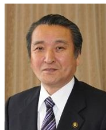
野田武則 釜石市長